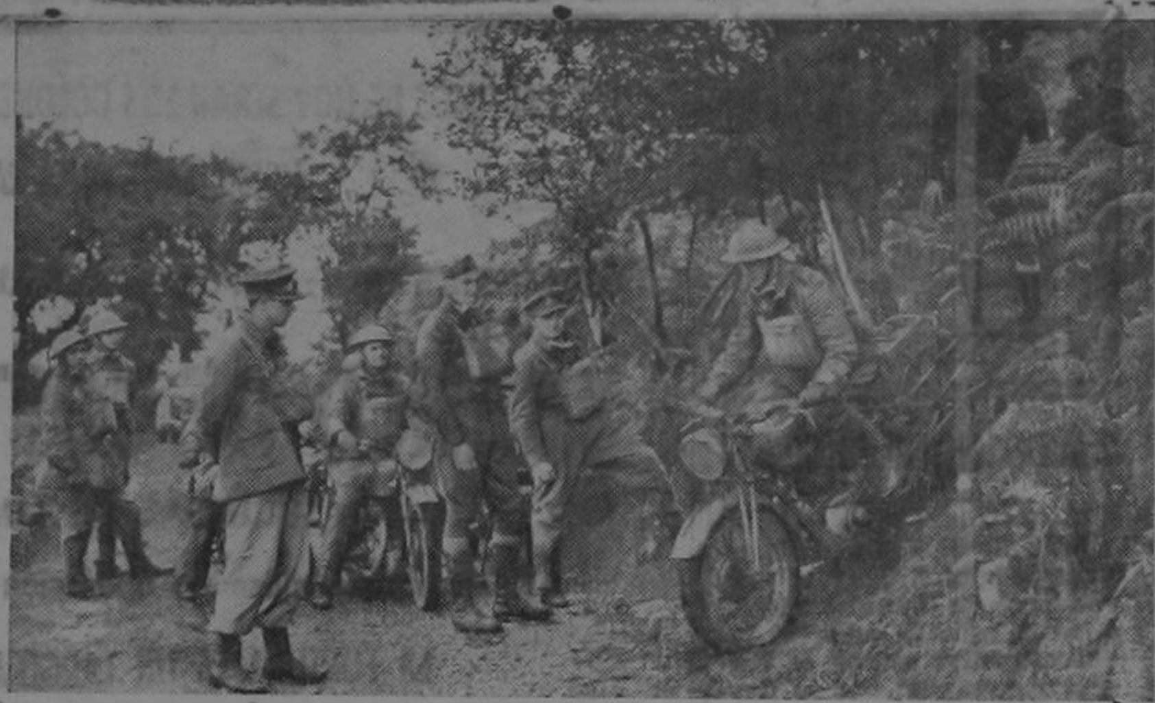
MECHANIZED ROUGH-RIDERS. — Australian, New Zealand and Canadian officers now stationed in the mountains in Wales undergo intensive training in motor-cycle rough-riding. Their instructors are British motor-cycle champions. Here is a rider negotiating a formidable decline.