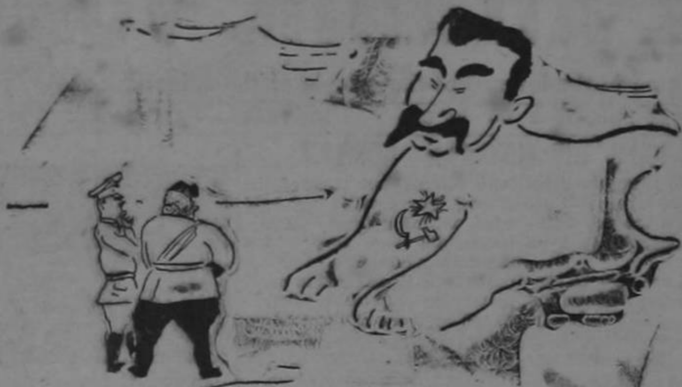
LE SPHINX DE MOSCOU

Cartoon from the Journal "France." Not available in British Isles.