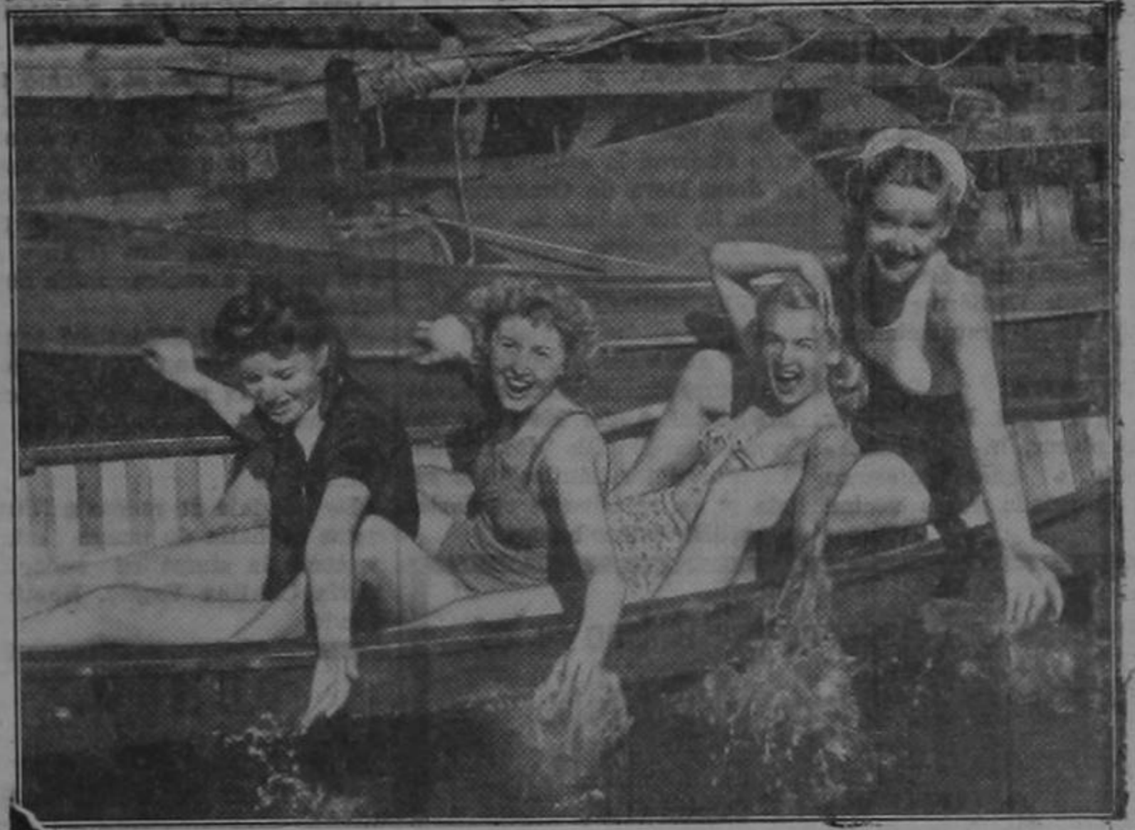
Será un golpe en el agua si ustedes quisieran juzgar la fogosidad de estas muchachas por sus sonrientes rostros. Aquella la mostrarán en sus papeles de "las cuatro Marys" en el film de la Ufa "El corazón de la Reina".

Si usted no es bonita, repetimos para concluir, no haga nada por serlo, porque no lo logrará. En cambio, aprenda a vestirse, sea chic, tenga una pulcritud exquisita, sea fina y gentil con los demás, y verá cómo logra atraer la admiración de todo el mundo, de una manera más duradera que con una cara bonita.